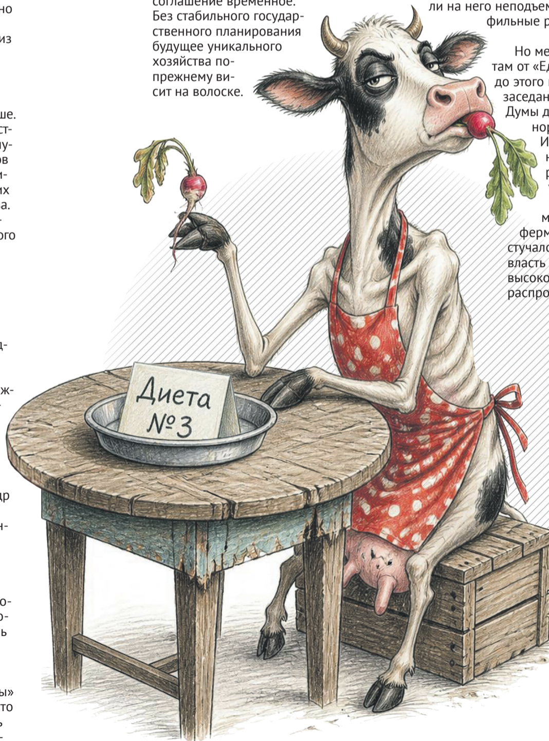
Иллюстрация: Елена Миронова

Но в феврале 2026 года наметились подвижки. В правительстве прошло совещание руководителей молочного завода и «Полярной звезды», на котором сторонам удалось урегулировать вопросы по взаимодействию. Есть в этой истории и подводный камень — соглашение временное. Без стабильного государственного планирования будущее уникального хозяйства по-прежнему висит на волоске.