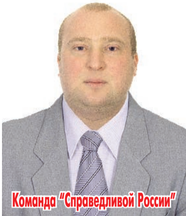
Команда "Справедливой России"