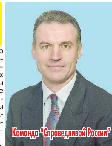
Команда "Справедливой России"

Мы сегодня должны шире и разностороннее смотреть