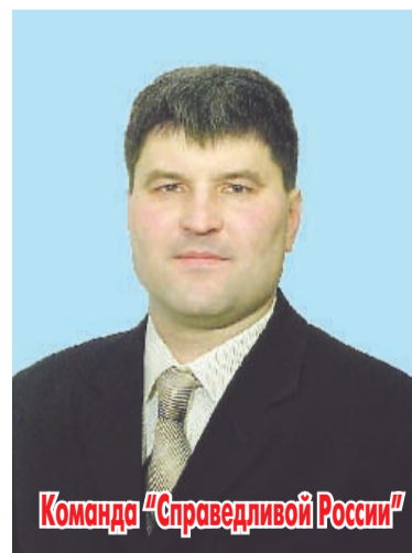
Команда "Справедливой России"

В городе мусор, дороги чистят плохо. Некогда живописные районы Зашейка и Африканды сегодня пребывают в плачевном