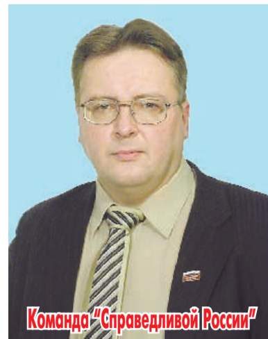
Команда "Справедливой России"

решение этих людей вновь идти во власть.