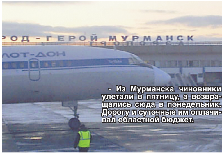
Из Мурманска чиновники улетали в пятницу, а возвращались сюда в понедельник. Дорогу и суточные им оплачивал областной бюджет.

Кстати, в договорах с новыми министрами вписывался только состав денежного содержания, а все остальные размеры всевозможных доплат не установлены, что не позволило аудиторам «установить конкретный размер оплаты труда, право на который