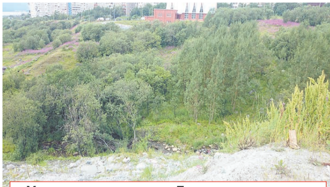
Участок-овраг на ул. Достоевского.