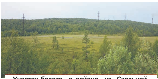
Участок-болото в районе ул. Скальной.

кам, стал не 67, а почему-то 73. Власти объясняют, дескать, приоритетным правом получения земли пользуются не просто многодетные, а многодетные малоимущие семьи и ряд льготников. Поэтому якобы и происходят такие «скачки». Вот только кто может проверить эти сведения? Когда очередники начинают задавать подобные вопросы, чиновники ссылаются на закон о защите персональных данных. Удобно, не правда ли?».