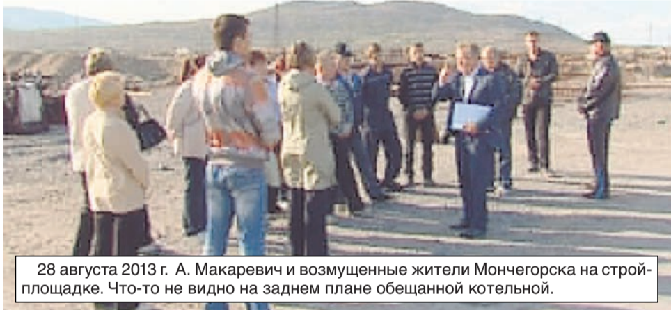
28 августа 2013 г. А. Макаревич и возмущенные жители Мончегорска на стройплощадке. Что-то не видно на заднем плане обещанной котельной.

А уже 6 апреля Д. Медведев проводит в Кировске рабочую встречу с только что назначенной и. о. губернатора М. Ковтун. Речь идет, в частности, об энергоэффективности, партнерстве бизнеса и правительства региона в решении этих задач.