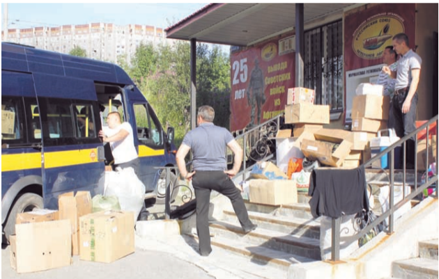
Гуманитарный груз для Донбасса.