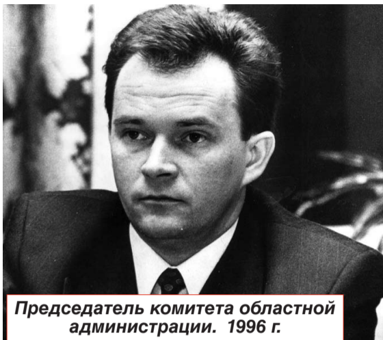
Председатель комитета областной администрации. 1996 г.

Но полное взаимопонимание не исключало острых рабочих моментов. Например, очень непросто он пробивал создание волонтерских центров при участии и финансировании организации «Норвежская народная помощь». Приходилось доказывать, отстаивать, даже конфликтовать. И он сумел убедить: не надо отталкивать руку, предлагающую помощь.