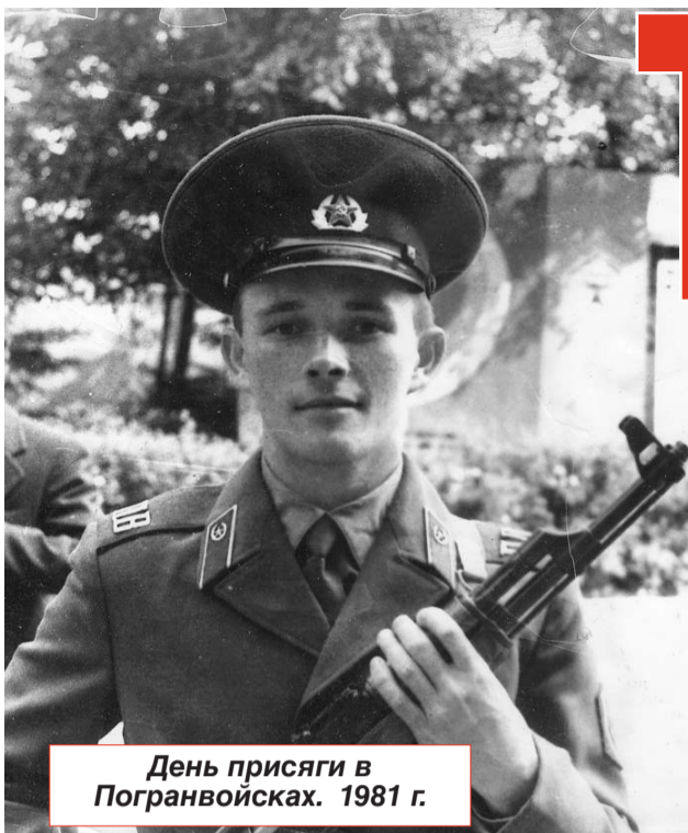
День присяги в Погранвойсках. 1981 г.