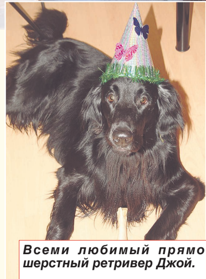
Всеми любимым прямошерстный ретривер Джой.