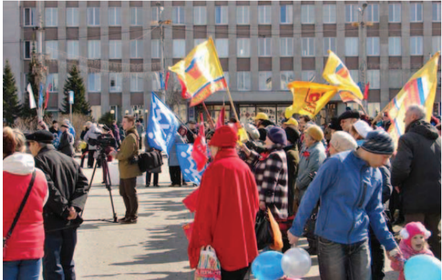
Справедливый Первомай в Кандалакше.