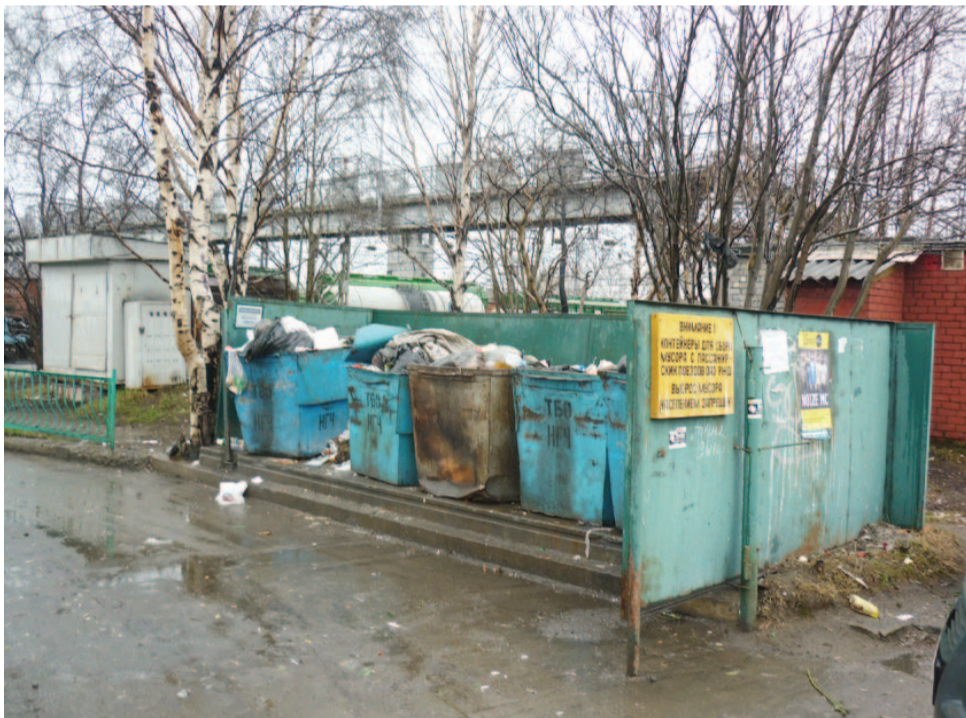
Народ присвоил этой «достопримечательности» имя руководителя железных дорог страны...