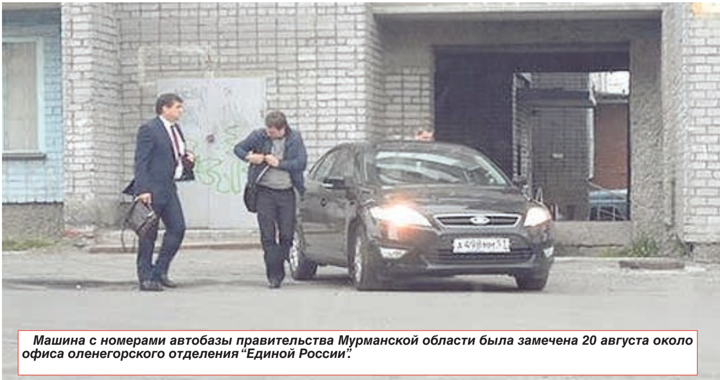
Машина с номерами автобазы правительства Мурманской области была замечена 20 августа около офиса оленегорского отделения «Единой России».

Любопытно, знакомы ли с данными законами люди, находившиеся в правительственных авто?