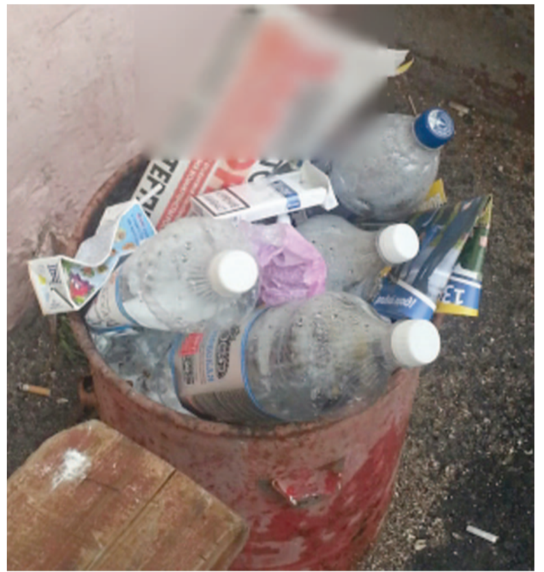
Североморск. Все правильно - мусор к мусору!

Кстати, судя по тому, кого газетка мочит, а кого нежно «целует в плечико», сразу видно, на кого власть сделала ставку и кто с ней в одну дуду дудит. Не полещет на своих страницах «Территория закона плюс» лишь «ЕР», ЛДПР и «Партию пенсионеров». Да и чего их полоскать, они ж слова против власти не скажут! Даже никак не отреагировали на возму-